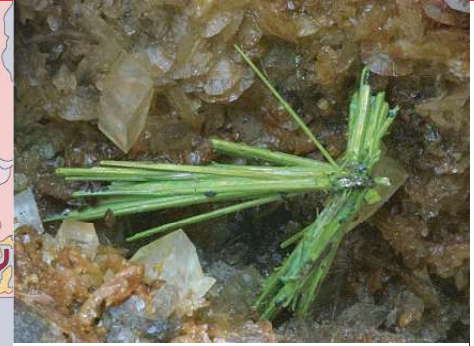
Millerite (nickel sulphide), Coal Measures Milerit (syffid nicel), Haenau Glo