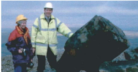
Fossil tree, Coal Measures, Dulais Valley Coeden ffosil, Haenau Glo, Cwm Dulais