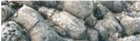
Pillow lavas, Ordovician, Pembrokeshire Lafa clustog, Ordofigaidd, Sir Benfro