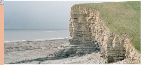
Jurassic strata, Vale of Glamorgan Strata Jwrasig, Bro Morgannwg