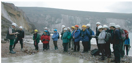
Members on a field trip Aelodau ar daith maes