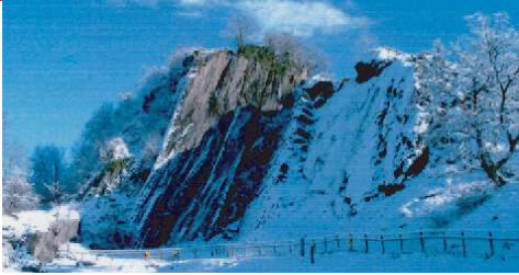
Carboniferous Limestone, Craig y Ddinas, Vale of Neath Calchfaen Carbonifferaidd, Craig y Ddinas, Dyffryn Nedd

Geology Department, National Museum of Wales WWW.SWGA.ORG.UK